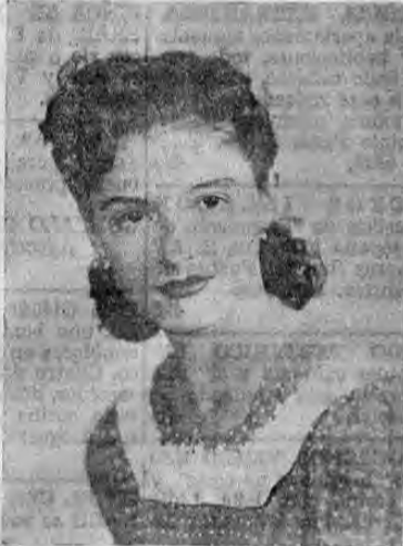
Señora RUTH OREAMUNO C.