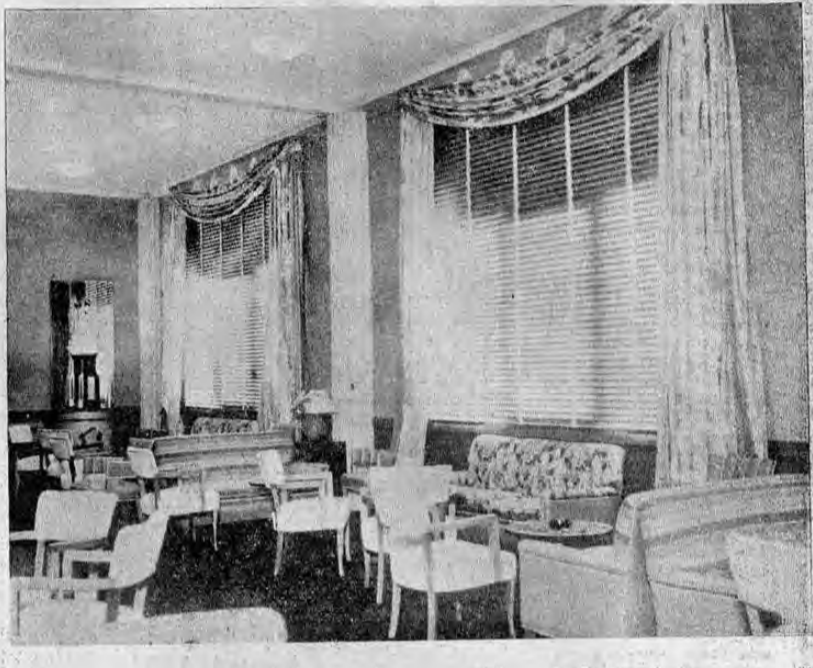
Las persianas Sol - Aire están construidas con finos y lustrosos listones de acero, flexibles, en colores especiales, para mejorar las condiciones de estética y confort de una habitación.