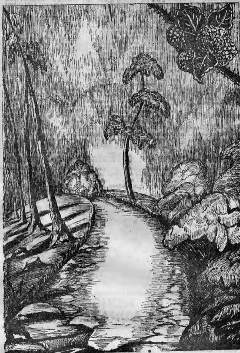
En las veredas húmedas y frías se recogen las fragantes moras destinadas a la fabricación de 2 excelentes productos naturales

NEW LONDON, 4 UP.—Roosevelt zarpó a bordo del yate presidencial Potomac, para realizar un crucero de vacaciones por las inmediaciones de la costa de Nueva Inglaterra.