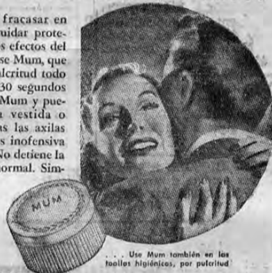
Use Mum también en las toallas higiénicas, por potestad